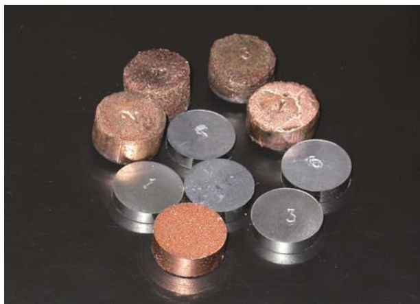
Рис. 1. Образцы материалов-доноров для формирования покрытий при комбинированной обработке гибким инструментом

качестве последнего используется вращающаяся металлическая щетка (ВМЩ) с проволочным ворсом [5, 6]. Сущность метода состоит в том, что в процессе обработки ВМЩ одновременно взаимодействует с поверхностью обрабатываемой детали и бруском из материала покрытия, используемого в качестве донора. В результате на поверхности детали образуется упрочненный слой основы с покрытием, которое формируется за счет переноса ворсинками щетки частичек материала-донора (рис. 1). В зависимости от состава материала-донора или их комбинации можно формировать металлические и полимерные покрытия практически любого функционального назначения на изделиях из металла, камня, керамики, стекла и др. Последующая механическая обработка сформированных покрытий не требуется.