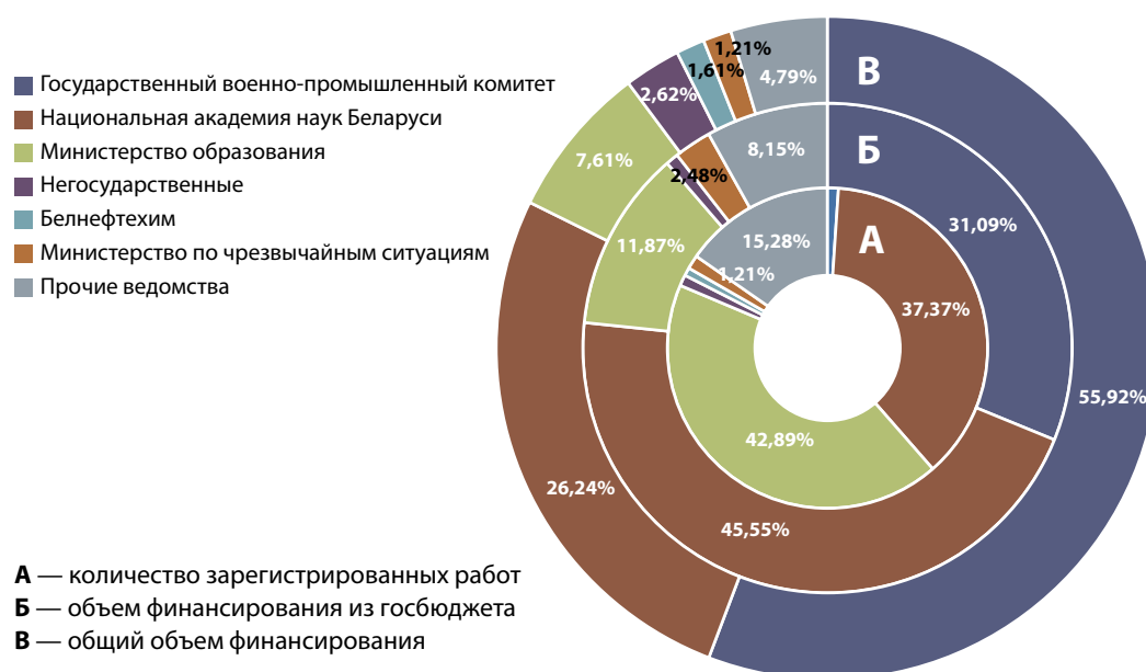
Рис. 4. Распределение количества и финансирования НИОКТР, которые прошли государственную регистрацию в I полугодии 2014 г., по органам государственного управления