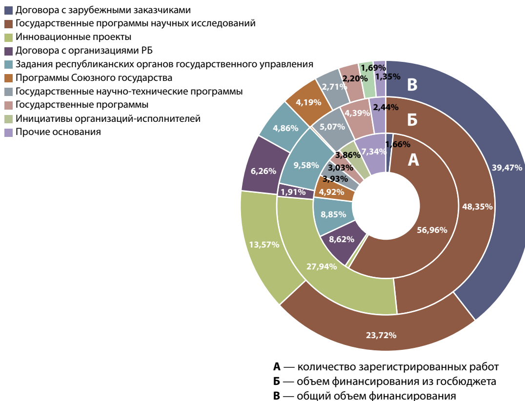
Рис. 2. Распределение количества и финансирования НИОКТР, которые прошли государственную регистрацию в I полугодии 2014 г., по основаниям для выполнения работ