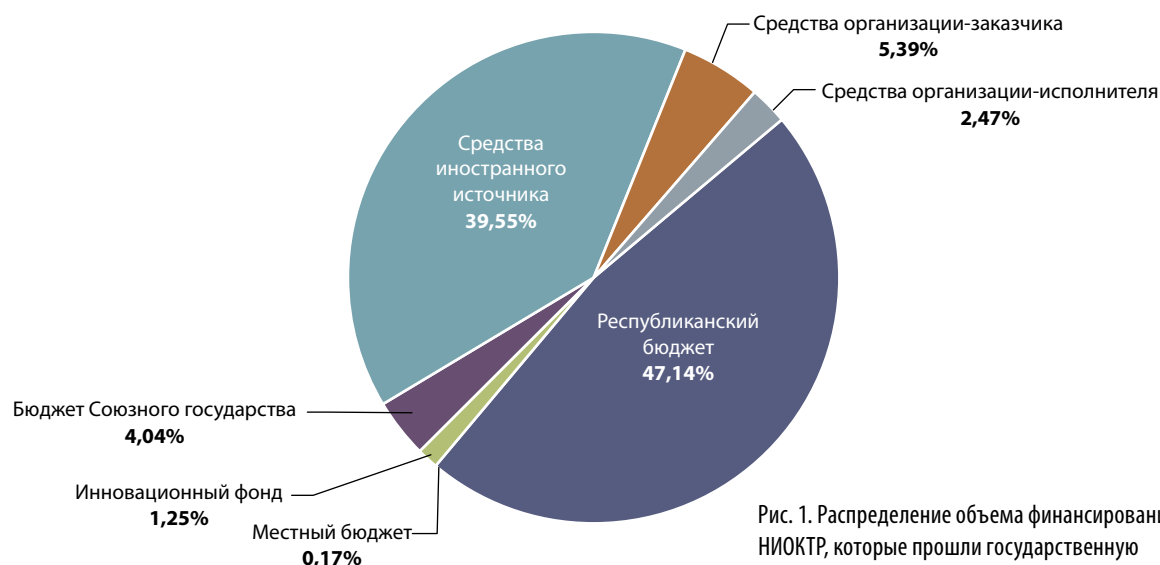
Рис. 1. Распределение объема финансирования НИОКТР, которые прошли государственную регистрацию в I полугодии 2014 г., по видам источников финансирования научной деятельности