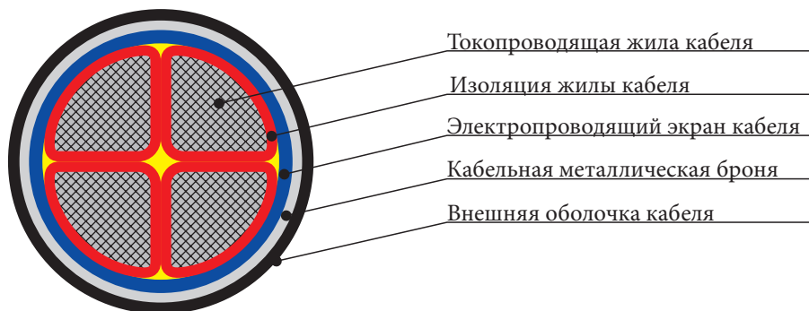
Рис. 2. Кабель с секторными жилами

Расчет геометрических параметров кабеля можно производить согласно методикам и формулам, представленным в СТБ 2194-2011. В настоящем стандарте приведен расчет геометрических размеров отдельных конструктивных элементов кабельных изделий, необходимых при расчете массы материалов [12, с. 1]. Однако применение указанного стандарта не всегда возможно, так как существуют сложности в определении параметров, указанных в формулах данного стандарта, в случае наличия только маркировки кабеля, с указанием количества жил и площадей их сечений. Таким образом, появляется необходимость более упрощенного расчета геометрических параметров кабеля.