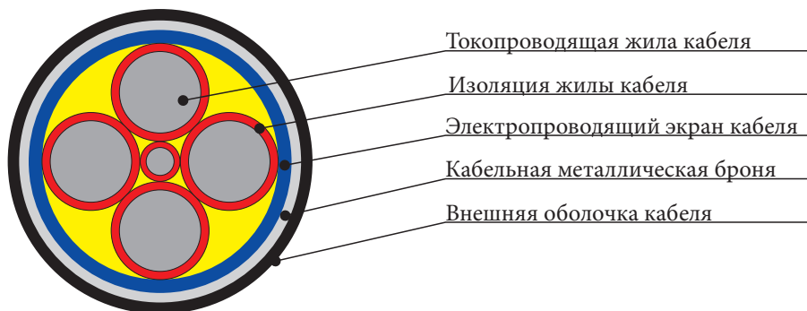
Рис. 3. Кабель с жилами круглого сечения (четыре основные жилы и одна нулевая жила круглого сечения)

\alpha — угол сектора (например, для трехжильного кабеля \alpha = 120^\circ , для четырехжильного кабеля \alpha = 90^\circ ), град.