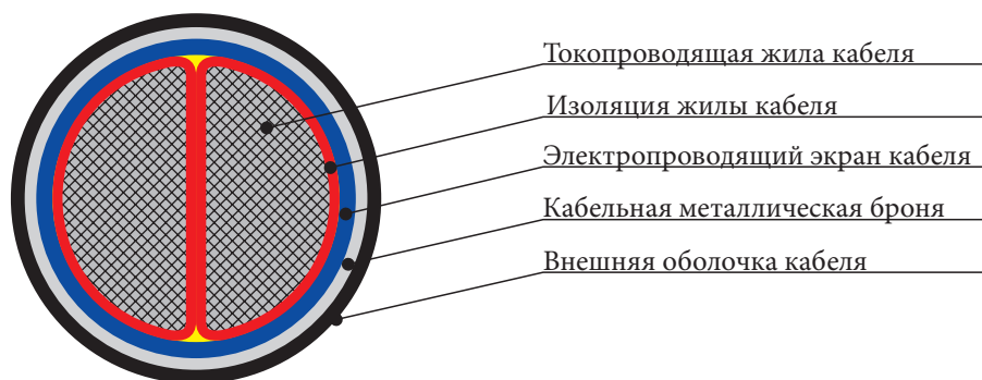
Рис. 5. Кабель с двумя сегментными жилами

Таким образом, диаметр кабеля с двумя сегментными жилами под металлической оболочкой будет рассчитываться по формуле: