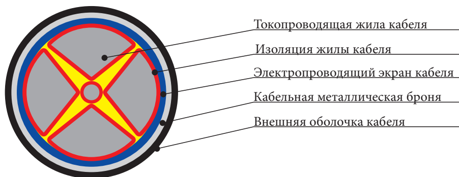
Рис. 4. Кабель с четырьмя основными секторными жилами и одной нулевой жилой круглого сечения

где r — радиус сечения основных секторных жил кабеля, мм;