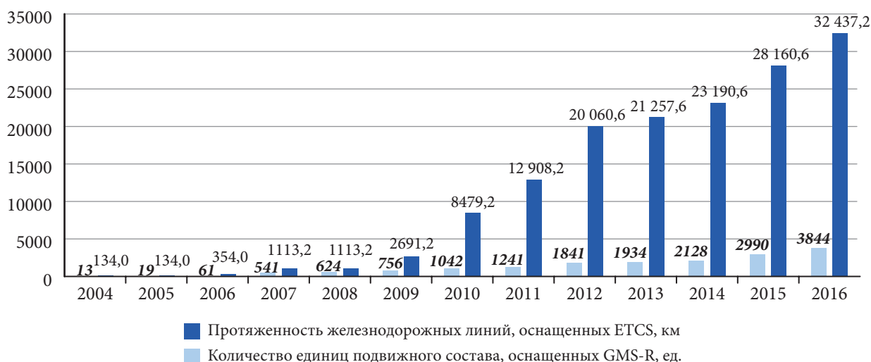
Рис. 3. Распространенность системы ERTMS

ERTMS включает в себя 2 подсистемы [13]: ETCS (система сигнализации, контроля и защиты