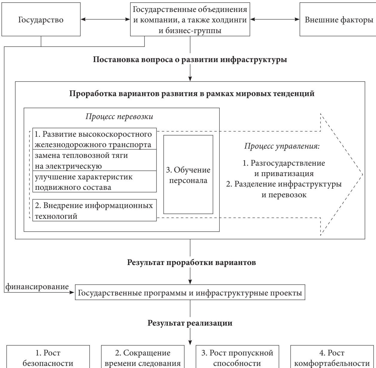
Рис. 4. Блок-схема развития инфраструктуры железнодорожного транспорта, основанная на мировых тенденциях

– развитие высокоскоростного транспорта с одновременной заменой используемой тепловозной тяги на электрическую и совершенствовани- ем подвижного состава;