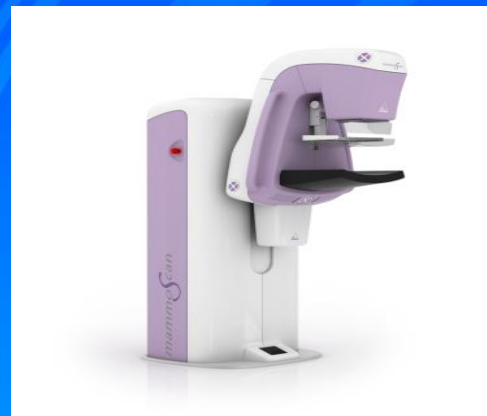
Цифровой рентгенографический маммограф (НПЧУП «АДАНИ», г. Минск)