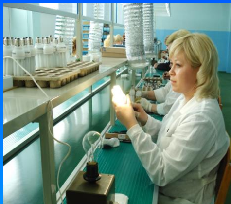
Производство компактных люминесцентных ламп (ОАО «БЭЛЗ», г. Брест)