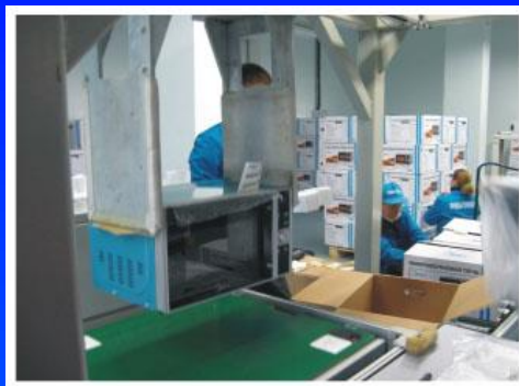
Производство изделий бытовой техники «Горизонт-Мидеа» (СВЧ-печи)