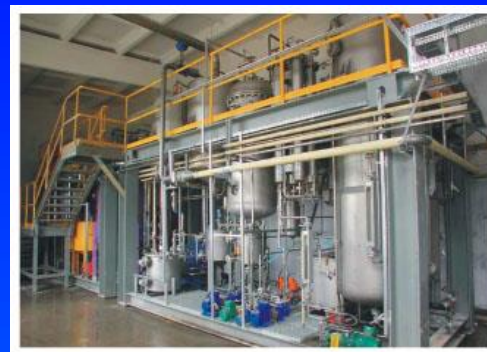
Установка для промышленного получения дизельного биотоплива из рапсового масла (ОАО «Гродно-Азот», г. Гродно)