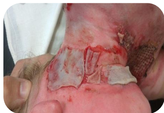
На пересаженную кожу