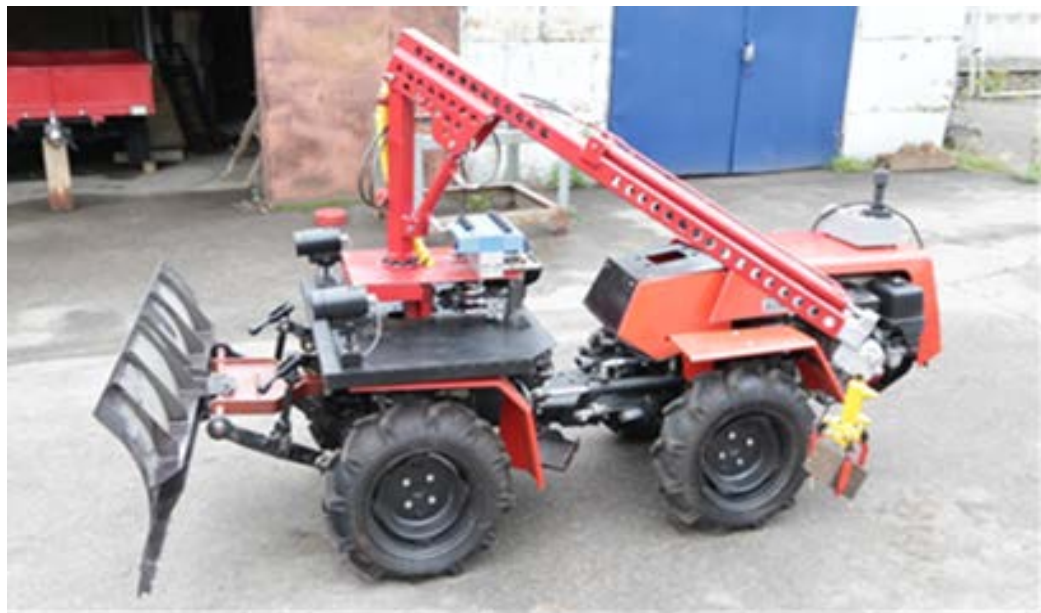
Прототип создан в 2015 г.

Планируемые к демонстрации образцы будут принципиально отличаться от прототипа, как по конструктивным, так и по функциональным характеристикам